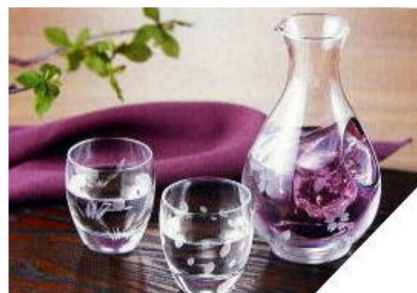
女将お進め冷酒サービス