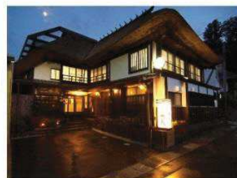
⑤ひのき風呂の宿 分家