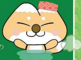
天栄村マスコットキャラクター 「ふたまたぎつね」

国民保養温泉地 二岐温泉、 岩瀬湯本温泉、天栄温泉は 「環境省 チーム新・湯治」の チーム員です。