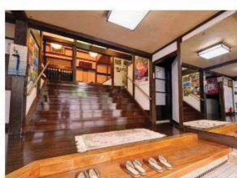
⑥源泉亭湯口屋旅館